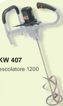
TKW 407 Mescolatore 1200