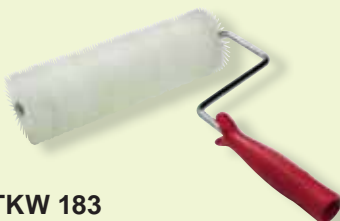
TKW 183 Rullo frangibolle