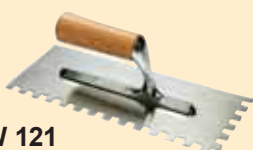
TKW 121 Spatola 10x10 mm