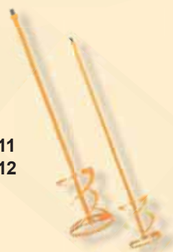
TKW 411 TKW 412