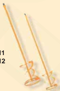
TKW 411 TKW 412