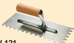
TKW 121 Spatola 10x10 mm