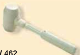
TKW 462 Martello di gomma bianca