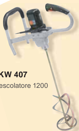
TKW 407 Mescolatore 1200