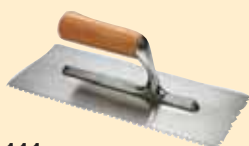
TKW 111 Spatola 8x8 mm