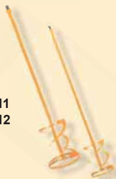
TKW 411 TKW 412