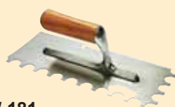
TKW 181 Spatola tonda Ø 15 mm