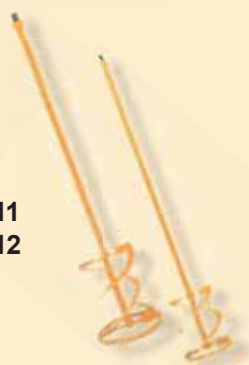
TKW 411 TKW 412