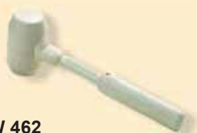
TKW 462 Martello di gomma bianca