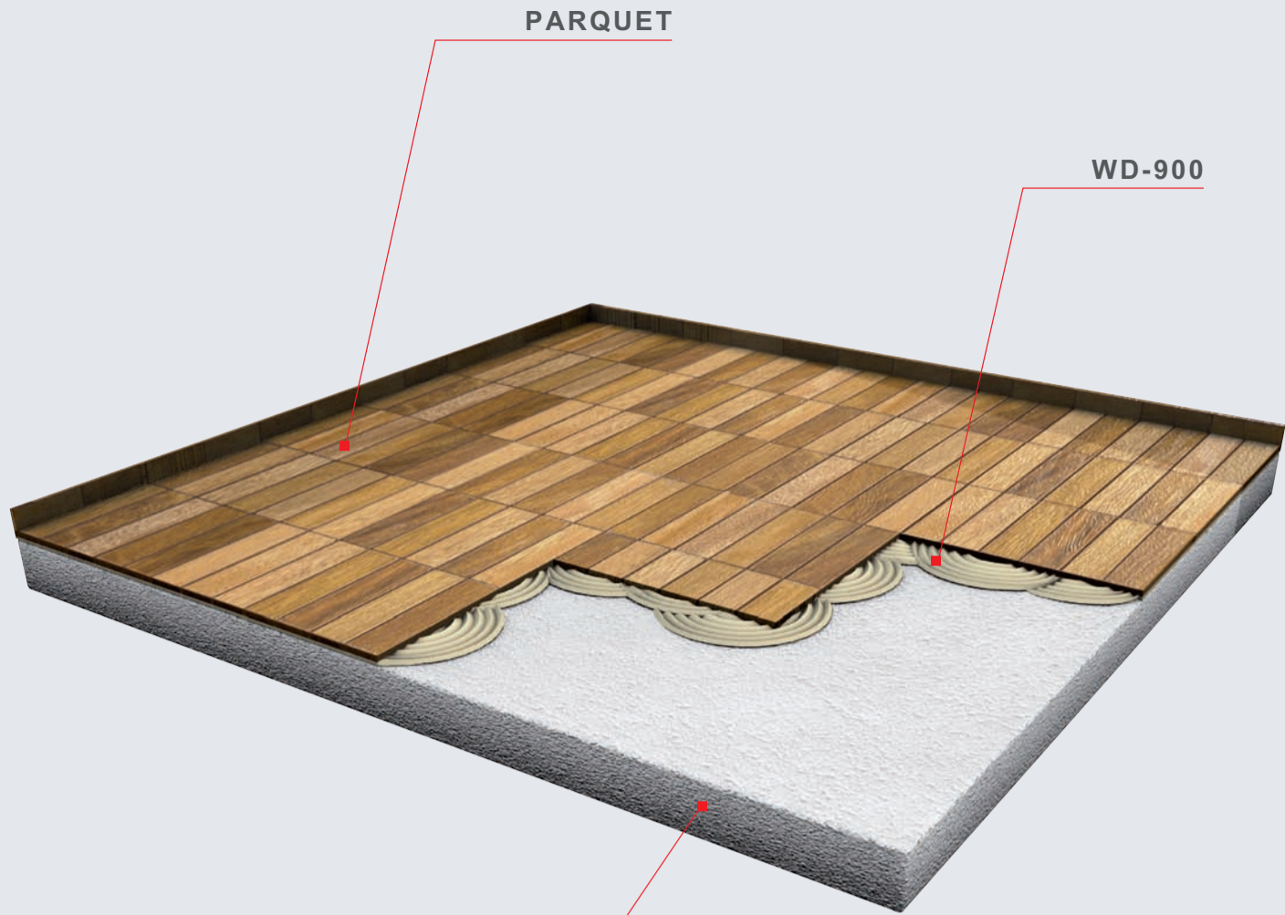
TIMER-2 CON FIBRE FS-18